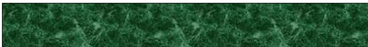
Slika 3. Naslov slike. Preuzeto s dopuštenjem autora: Ivo Ivić.

Brojka u zagradi označava referenciju u popisu literature.